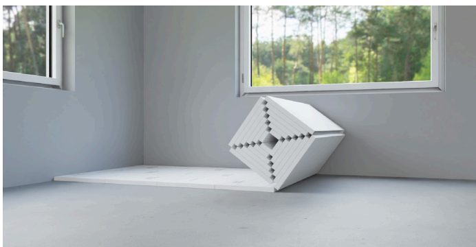
BEWI Step Trinnlydsplate leveres på rull og rulles enkelt ut på byggeplass.