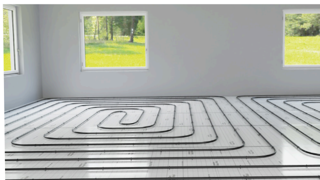
Trinnlydsplaten fra BEWI er spesielt egnet for vannbåren varme.